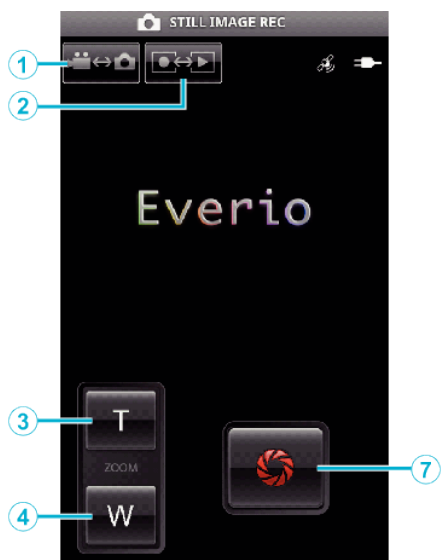
حالت ضبط تصویر ثابت