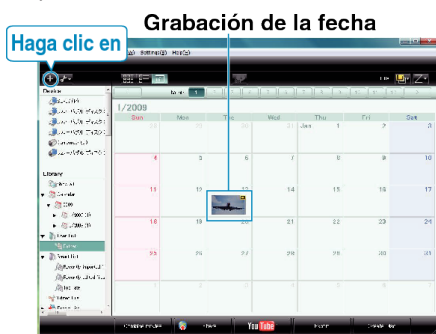
Grabación de la fecha

1 Escriba el nombre de la nueva lista personalizada