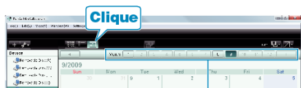
Gravação do mês

1 Exiba o mês dos arquivos para organizar.